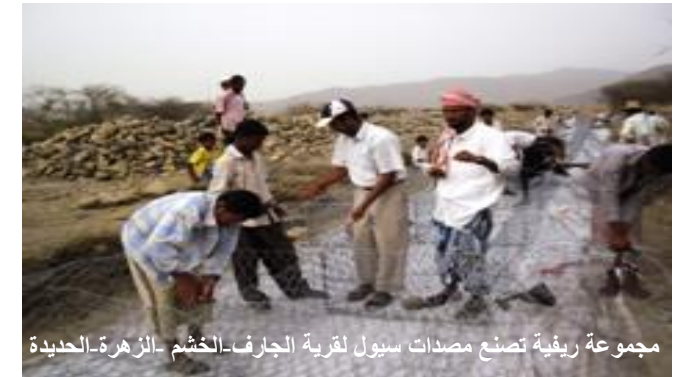
مجموعة ريفية تصنع مصدات سيول لقرية الحارث-الحشم-الزهرة-الحديدة

وتفدّت أيضاً أنشطة بناء قدرات 17 مجموعة في تربية النحل، ولفترة أسبوعين، في مديرتي المنصورية واللحية (الحديدة). وتُرَب 19 استشارياً في تكوين 7 مجموعات إنتاجية (بين المجتمعات) في همدان وأرحب (صنعاء). وتم كذلك تدريب 48 عضواً من لجان المنتجين الريفيين في مديرية المضاربة وراس العارة (بمحافظة لحج)، والاستعانة بأحد عشر استشارياً لتنفيذ متابعات وإعداد دراسات وبناء قدرات المجموعات في طور الباحة والمقاطرة والقبيلة (لحج). وتم كذلك بناء قدرات وتأهيل 65 مرشداً وأخصائياً زراعياً في محافظة مأرب في تخطيط وتقييم البرامج الإرشادية الزراعية.