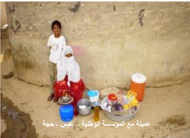
عملية مع المؤسسة الوطنية - عبس - حجة

تتويجاً للنجاحات التي حققها بنك الأمل للتمويل الأصغر، تم تتويجه بجائزة MIX الفضية في الأداء الاجتماعي لعام 2011، حيث تم اختياره للفوز بهذه الجائزة وفقاً للمعايير الدولية في الأداء الاجتماعي الذي يحمل رسالة اجتماعية تكمن في تقديم خدمات مالية وغير مالية للفئات الأكثر فقراً في المجتمع من ذوي الدخل المحدود والمنخفض وأصحاب المشاريع الصغيرة والأصغر، والتركيز على شريحتي الشباب والمرأة لغرض تحسين ظروفهم المعيشية، ومساعدتهم على الخروج من الفقر. كما يساهم البنك على المستوى الإقليمي في تأسيس أول مؤسسة تمويل أصغر في الصومال من خلال تقديم الدعم الفني (المرحلة الأولى) لمنظمة "العون يُنعش الأمل" (Help leads to hope)، وقد تم إطلاع مدير المنظمة الذي زار بنك الأمل على تجربة البنك من خلال البرنامج الذي أعده للمؤسسات الناشئة في مجال التمويل الأصغر.