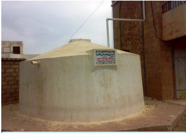
خزان فرومنت لتجميع مياه الأمطار بقرية عفاقة- صبرا الموادم - تعز

الرابعة و30% في الفئة الثالثة. وتحتوي المشاريع على 54 خزاناً لحصاد مياه الأمطار بسعة إجمالية 80,000 م 3 ، وستة عشر كرفياً بسعة إجمالية 58,000 م 3 ، و9,407 سقايات خاصة بسعة إجمالية 465,900 م 3 ، وأنابيب بطول إجمالي 15,400 متر لتقريب الخدمة. وقد بدأ العمل الفعلي في 88 مشروعاً.