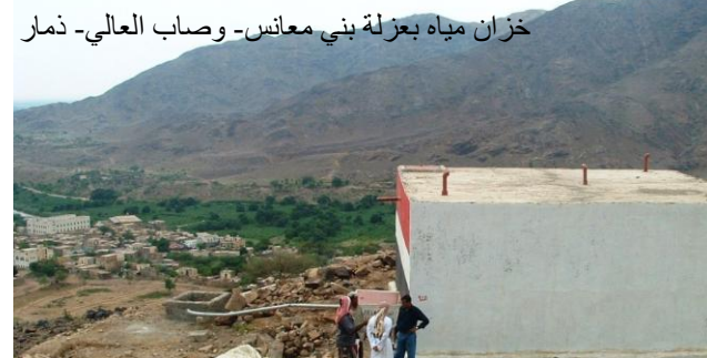
خزان مياه بعزلة بني معانس- وصاب العالي- ذمار

ويتواصل تنفيذ 4 مشاريع سقايات خاصة (عزلة القحيفة، جبل حبشي، تعز)، ومشروع مماثل في عدة قرى في عزلة وادعة. كما تتم متابعة تنفيذ مشروع تحسين وشق طريق المحلة - الميرك - الرضم - الصراف (بني معانس)، ومشروع تأهيل وتحسين طريق عرزمة - عمق (الأثلوث)، ومشروع السقايات الخاصة لقرى واعي وموركة وهياج العلب (الأثلوث). وكذا مشروعات إنشاء برك مغطاة في قرية بارق ووادي الاحلاء (عزلة بني علي، ملحان، المحويت).