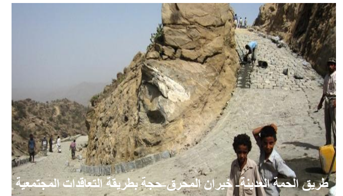
طريق الحمة العذبة- خيران المحرق-حجة بطريقة التعاقدات المجتمعية

فيما يخص المتابعة الميدانية لمشاريع القطاع، فقد تمت - خلال الربع - زيارة 41 مشروعاً مؤرّعة بين مشاريع قيد التنفيذ (للاطلاع على مستوى الجودة في الأعمال المنفذة) ومشاريع من خطه 2012 (للاطلاع على جودة الاستهداف، ومدى مطابقة المشاريع للمعايير المحددة للاستهداف). وبذلك يكون العدد الإجمالي التراكمي للمشاريع التي تمت زيارتها 225 مشروعاً.